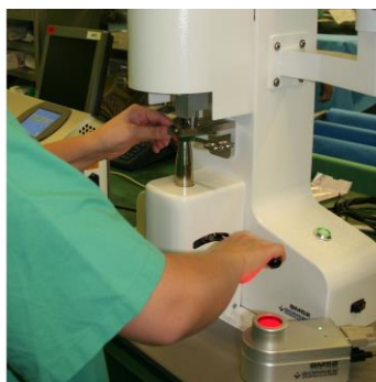
Wprowadzanie danych lub przesyłanie z bazy danych