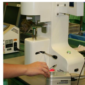
Odczyt kodu DataMatrix